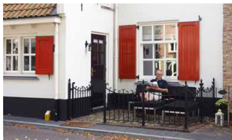
De oude vissershuisjes geven kleur aan de historische binnenstad van Harderwijk.