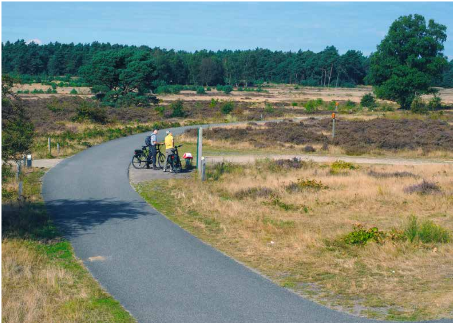
Nationaal Park De Hoge Veluwe is met zijn 5.500 hectare aan bos, heide, vennen en stuifzand ideaal voor fietsers.