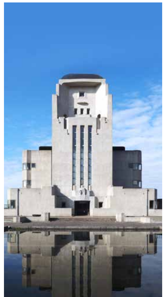
De betonnen kathedraal van zenderpark Radio Kootwijk behoort tot de mooiste staaltjes art deco in Nederland.