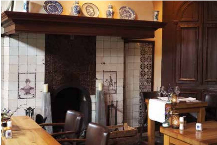
Laat je culinair verwennen in Fine Dining Restaurant 'De Zwarte Boer' in Ermelo.

In het zuiden van De Veluwe ligt Kasteel Rosendaal, dat dateert uit de 14de eeuw. Een oorspronkelijk versterkt huis groeide uit tot een imposante burcht die dienst deed als een van de residenties van de hertogen en graven van Gelderland. Tot 1977 werd het kasteel bewoond door vooraanstaande families. De woonvertrekken zijn uitgerust met meubels en schilderijen uit verschillende stijlperiodes. Jaren geleden werd het vervallen kasteel grondig gerestaureerd. Op een van de gevelstenen uit 1616 lezen we de passende spreuk 'tandem e spinis rosa': uiteindelijk groeit uit de doornen een roos. Het uitgestrekte landschapspark rond het kasteel nodigt uit tot kuieren. Met onder meer een rozentuin, een waterval, waterwerken zoals de 'bedriegertjes' – zeker even uitproberen! – en een schelpengalerij, is het park een echt wandelparadijs. We sluiten onze tocht door De Veluwe af met een kopje koffie in de oranjerie. Uitkijkend op de kasteelvijver, genieten we na van zoveel cultuur en natuurschoon. ■