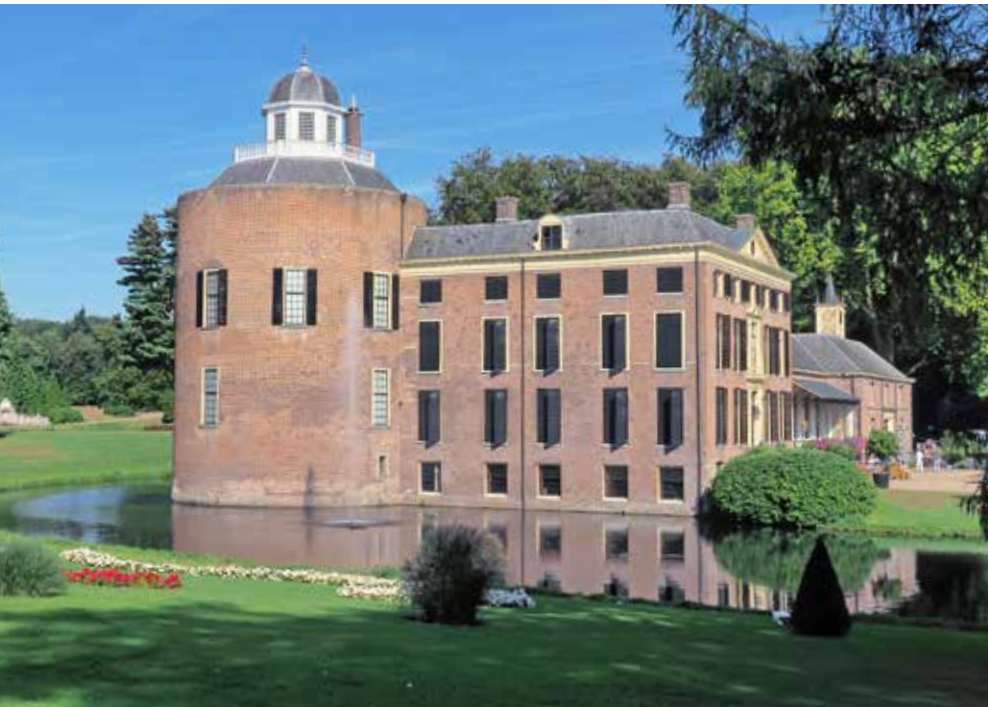
Het 14de-eeuwse Kasteel Rosendaal wordt omgeven door een uitgestrekt landschapspark.