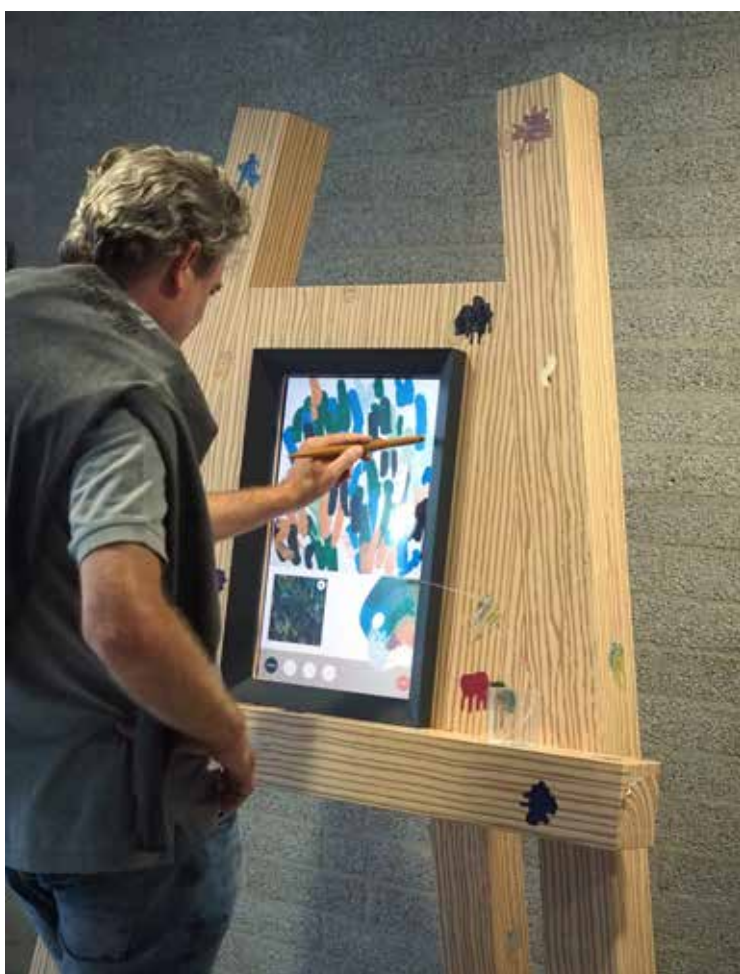
Met het digitale schilderspel 'Schilderen met de meesters' in het Kröller-Möller Museum ga je Mondriaan en Van Gogh zo achterna.