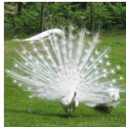
De waaiers van witte pauwenveren werden bij ridderspelen gebruikt als versiering voor de helmen.