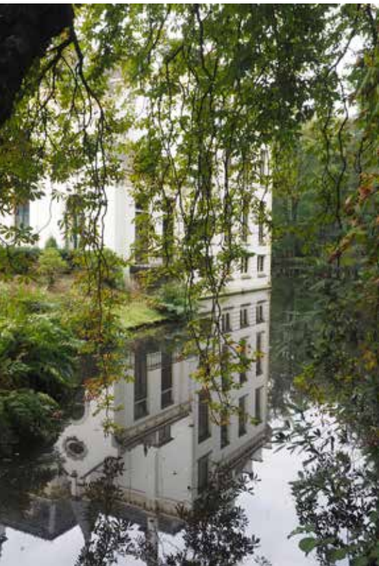
Het landgoed Staverden neemt ons mee door eeuwenlang adellijk leven op de Veluwe.

Radio Kootwijk was lang het centrum van radioverkeer met schepen en vliegtuigen over de hele wereld. Tijdens de oorlog gebruikten de Duitsers het station voor communicatie met onderzeeboten. Door de moderne communicatietechnieken verloor het zijn functie en eind 1998 verdween Radio Kootwijk definitief uit de ether. Het gebouw kan je binnenin enkel bezoeken tijdens georganiseerde activiteiten.