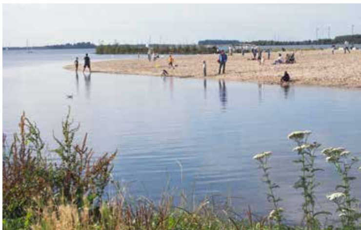
Uitkijkend op het Wolderwijd, is het heerlijk zonnebaden op het Strandeiland in Harderwijk.