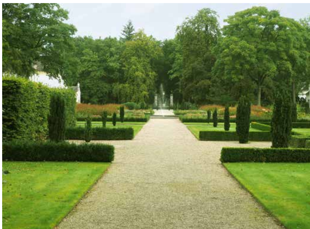
Zalig kuieren in de renaissancetuin van Staverden.

Dit eeuwenoud vissersstadje aan het Wolderwijd kijkt uit op het Veluwemeer. Met de rug naar het water ontdek je vrij snel de monumentale Vischpoort en de vuurtoren die vroeger de vissers veilig binnenloodste. Ooit werd hier actief op haring en pladijs gevist, die op de nabijgelegen Vischmarkt werd verkocht. Je vindt er eeuwenoude vissershuisjes, nu kleurrijk opgeknapt, waarvan sommige beschermd zijn. In één van de vroegere vissershuisjes is het restaurant Da Gabriele (Vischmarkt 31) ondergebracht. Geniet hier van een lekkere maaltijd in een sfeervol decor. Benieuwd naar de geschiedenis van Harderwijk? Trek dan naar het Stadsmuseum aan de Donkerstraat. Hier ontdek je dat Harderwijk in de 14de en 15de eeuw een welvarende Hanzestad was. Dat rijke verleden laat ook in de straten zijn sporen na. Ga zeker eens kijken naar de robuuste stukken stadsmuur, de prachtige 14de-eeuwse fresco's in de O.-L.-Vrouwekerk en de 15de-eeuwse Raadzaal in het oud gemeentehuis aan