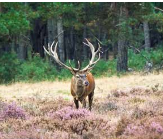
Oog in oog met een edelhert in het Nationaal Park De Hoge Veluwe.

Helemaal opgeladen na een stevige lunch, trekken we naar de Ermelosche heide. De schrale, droge heidegrond werd gevormd door gletsjers die vanuit Scandinavië de grond naar boven stuwden en zo stuwwallen creëerden die het water tegenhielden. Vanaf het bezoekerscentrum worden het hele jaar door tal van (geleide) wandelingen en activiteiten georganiseerd. Doorheen de verschillende seizoenen loop je hier tussen struik-, kraai- of dopheide en proef je van meer dan twintig streekproducten. Het label Erkend Veluws Streekproduct waarborgt dat alle ingrediënten uit de regio komen. In dit gebied van 380 hectare, bots je hier