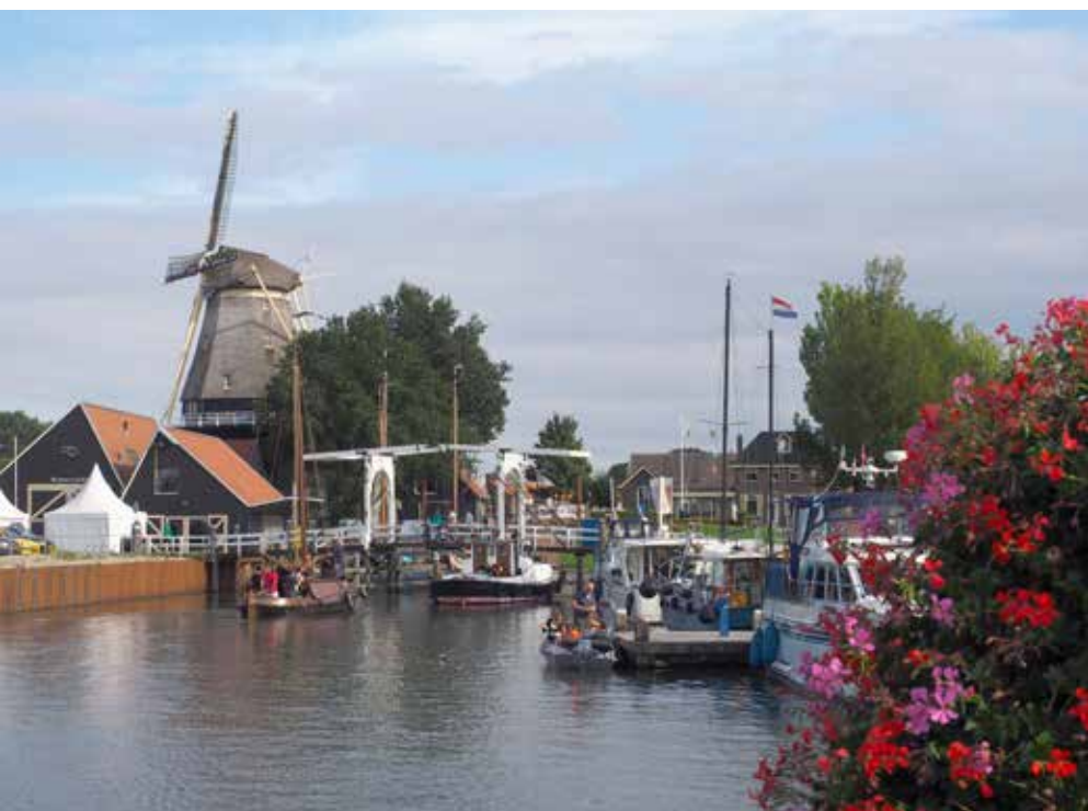
Naast een rijke geschiedenis, biedt Harderwijk ook een gezellige haven.

Op zes kilometer ten zuiden van Harderwijk wenkt het sympathieke stadje Ermelo met zijn Ermelosche heide en Schaapskooi. Het stadje zelf is geen toeristische trekpleister, maar wellicht precies daardoor best genietbaar. Modern en gastvrij, heeft het stadje zich doorheen de jaren met grote zorg voor mens en milieu ontwikkeld. Het is er heerlijk flaneren in de verkeersvrije Stationsstraat, waar koning voetganger op een rode loper loopt. Ook parkeren is er gratis. Op het Molenaarsplein vind je het vriendelijke WV-kantoor waar je naast alle info over de regio, talloze streekproducten kan bekomen. Het plein is vernoemd naar de molen dat nu het Museum Het Pakhuis herbergt: een archeologisch en natuurhistorisch museum dat je doorheen het verre verleden van Ermelo loodst. Een hongertje? Ga voor een snelle hap naar de hippe Ermelosche Frieztaak (Branderskamp 4) of voor een uitgebreidere lunch naar De DorpsKamer (Stationsstraat 5), waar je de specialiteit arretjescake kan proeven.