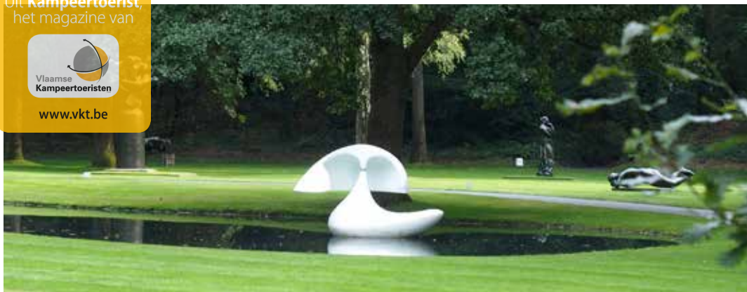
Cultuur ontmoet natuur in de adembenemende beeldentuin van het Kröller-Müller Museum.