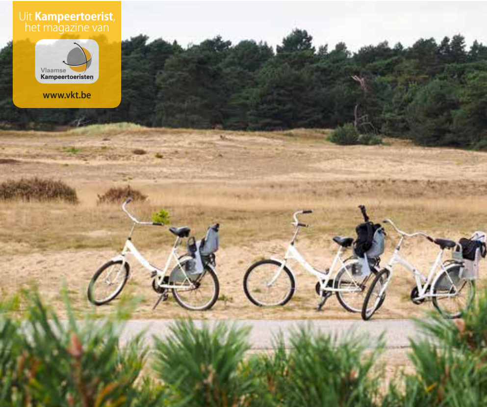
De ideale omgeving voor een tochtje met de fiets.