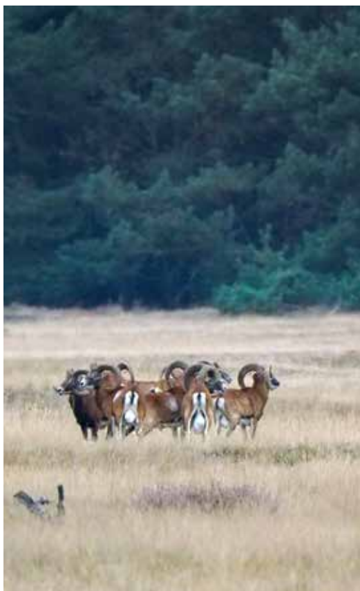
Tijdens onze fietstocht komen we oog in oog te staan met een kudde moeflons.