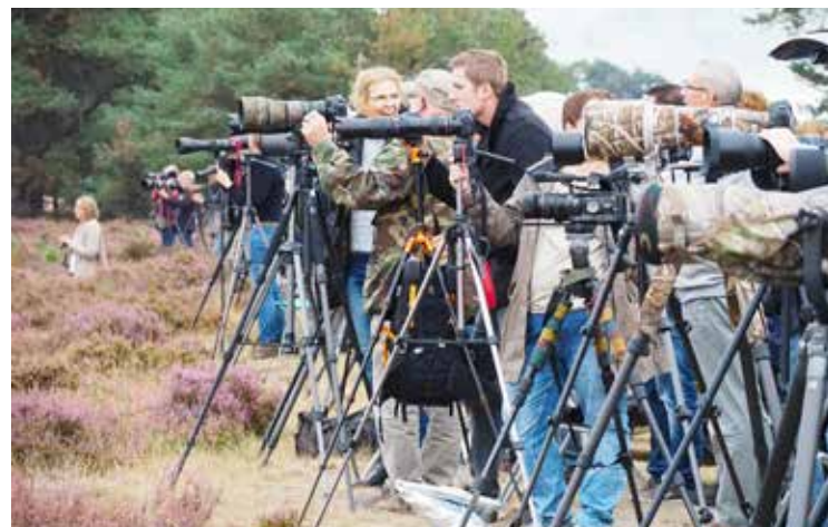
Wil je foto's maken van de koning van het Park, dan is een teelens geen overbodige luxe.