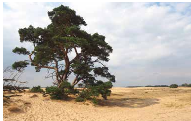
Met een oppervlakte van 700 hectare is het Kootwijkerzand de grootste actieve zandverstuiving van West-Europa.